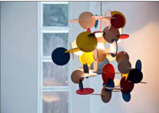
Sisustus hulluttelee muodoilla ja väreillä.