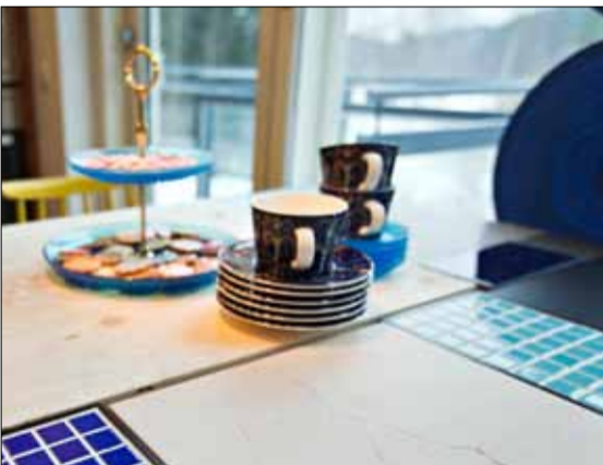
Ruokapöytä uudistui jämäläatoilla ja vanerilevyllä.