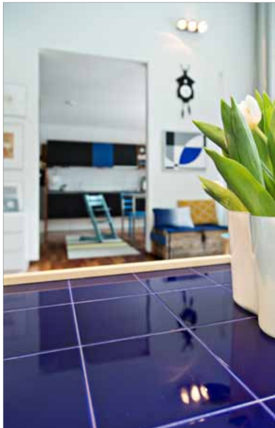
Artekin klassikkotuotekin hohtaa sinisen sävyissä.

” Sinisen paluusta kertoo muun muassa se, että monia klassikkotuotteita, kuten Ilmari Tapiovaaran Made-moiselle -tuolin, saa nyt sinisenä.