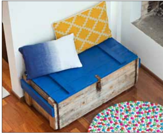
Harmaan, ruskean ja mustan jälkeen kodit saavat nyt väriä.

Suomalaisten perinteinen suosikkiväri sininen on palannut sisustukseen, ja näillä vinkeillä vanha suola alkaa janottaa.