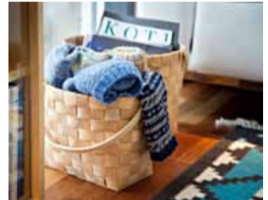
Supisuomalaista – pärekori ja villasukat.

” Sinisen paluusta kertoo muun muassa se, että monia klassikkotuotteita, kuten Ilmari Tapiovaaran Made-moiselle -tuolin, saa nyt sinisenä.