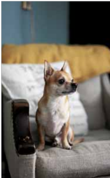
Mederin chihuahua Yoda vahtii tomerasti tonttiaan.