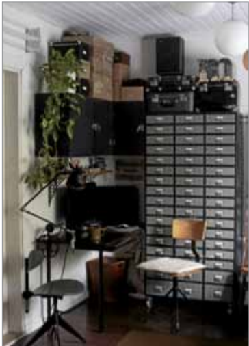
Työhuoneessa on entinen vesilaitoksen arkistokaappi.