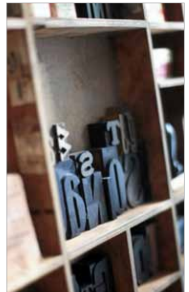
Meder tilasi vanhat painokirjaimet amerikkalaisesta nettikaupasta.

loksi, joka on tehty sen ajan vähillä tarpeilla.