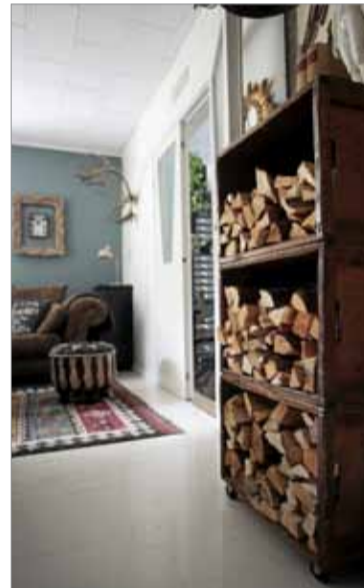
Talon asukkaat nauttavat vanhojen pönttöuunien tullen lämmöstä.