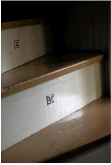
Talossa on paljon vanhoja kauppojen ja tehtaiden kyttejä.