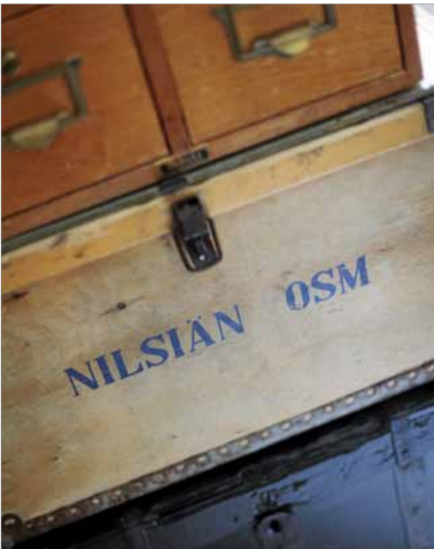
Nilsian Osuusmeijerin laatikko on saanut sijansa Järvenpäässä. Laatikko on löytö kuopiolaiselta kirpputorilta.