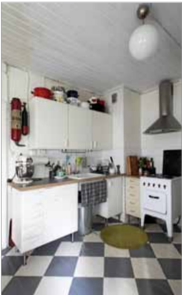
Keittiön esikuvana toimi Kuopion Mölymäen mummulan keittiö.